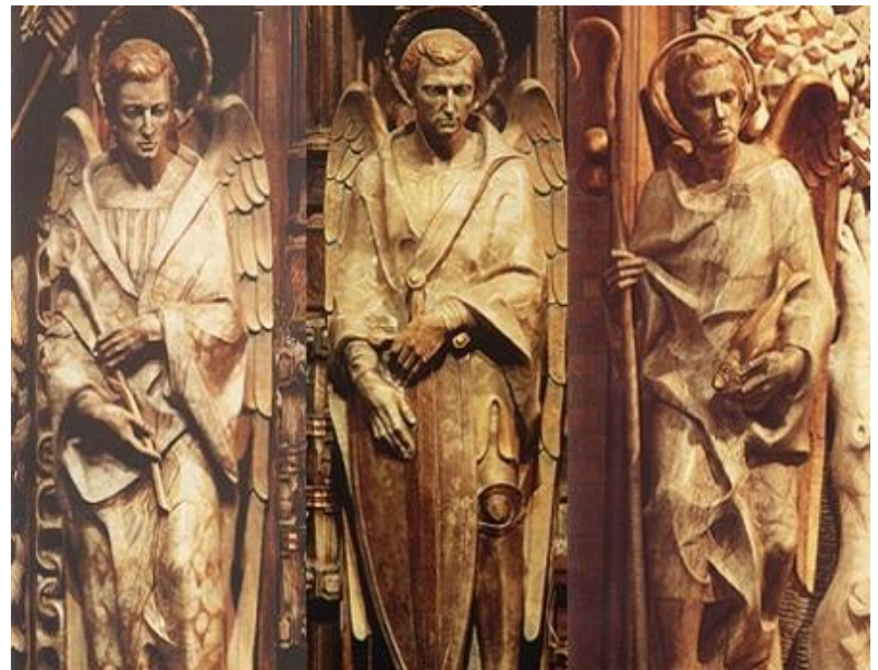
Relief der drei Erzengel im Altarbild von Torreciudad.

Rufen wir ihre mächtige Fürsprache an und verehren wir sie, damit wir in den ganz konkreten Situationen des Alltags den Willen Gottes erkennen und tun!