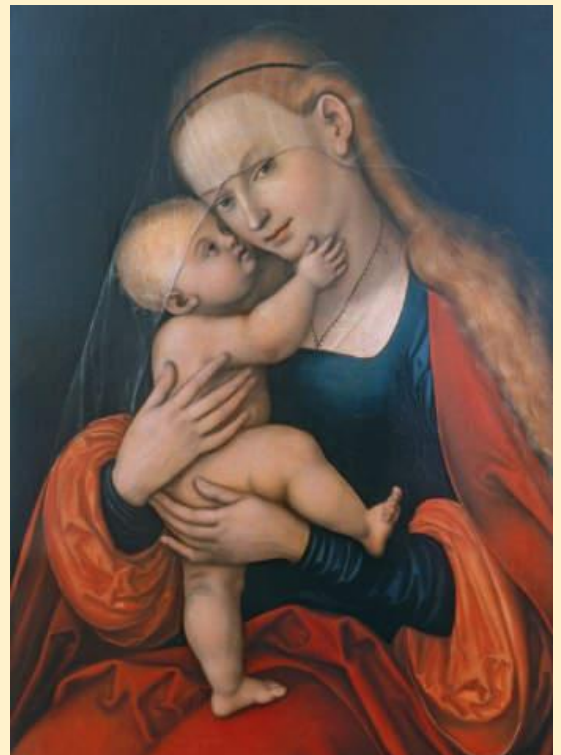
Passauer Gnadenbild von Lucas Cranach der Ältere.

Der Mai mit seinem aufbrechenden Leben wird bewusst auch als Marienmonat bezeichnet. Von der katholischen Kirche wird er als ein Monat begangen, in dem in besonderer Weise die Gottesmutter Maria verehrt wird - als diejenige, die Jesus und somit die Hoffnung auf Leben in die Welt gebracht hat.